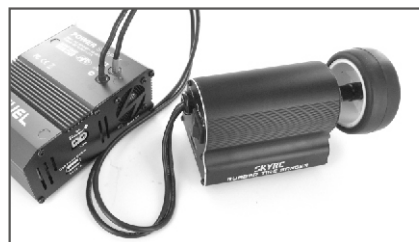
3、用12V电源或者2SLiPo电池 给磨胎机供电