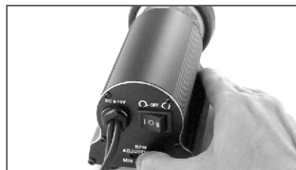
5、调节转速（如果需要）