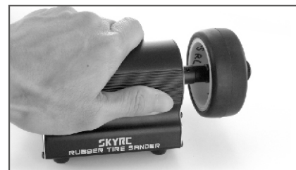
6、一切就绪，可开始磨胎了