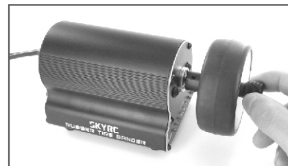
2、将橡胶轮胎装上， 然后再拧紧锁止螺母